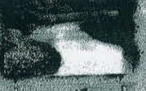
جنگل حرا ۸ کیلومتری اقامتگاه