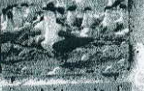
جزیره نخیلو ۱۰ مایلی اقامتگاه