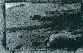
جزیره ام الکرم ۴ مایلی اقامتگاه