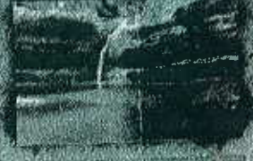
ابشار گزخون ۴ کیلومتری اقامتگاه