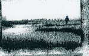
طبیعت گردی روستای نرکوه