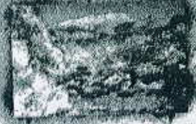
کوه نمک ۴۵ کیلومتری اقامتگاه