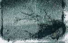
کویر شهنیاء ۲۰ کیلومتری اقامتگاه