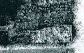
آثار باستانی دوره های ساسانی مربوط به قبل از اسلام ۵۰ متری اقامتگاه

شخصی ۱۵۰۰۰۰ تور ۱۵۰۰۰۰ خارجی ۲۵۰۰۰۰ جزیره امالکرم شخصی ۴۰۰۰۰ تور ۴۰۰۰۰ خارجی ۶۰۰۰۰۰ جزیره نخیلو