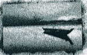
ساروینس قایق سواری